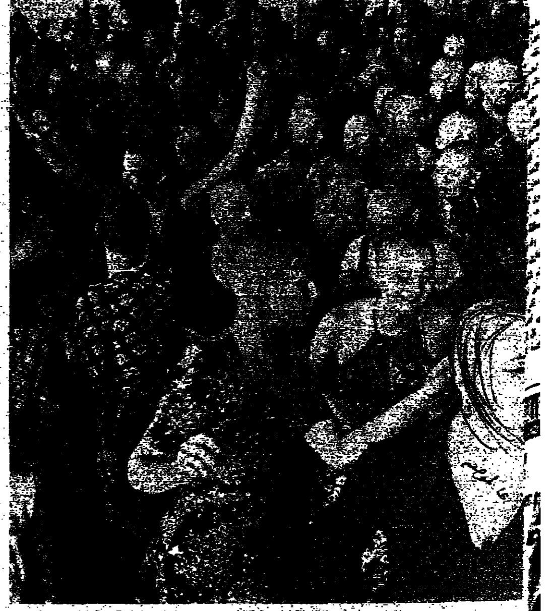
جميعهم من جمعية خيرية إسرائيلية... (Caption text describing the group in the photo)